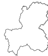
ぎ ふ け ん 岐阜県