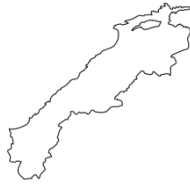
し ま ね け ん 島根県