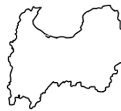
と や ま け ん 富山県