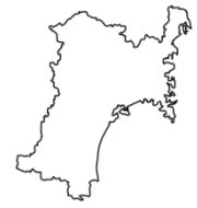
み や ぎ け ん 宮城県