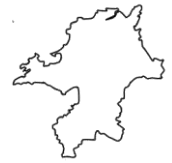
ふくおかけん 福岡県