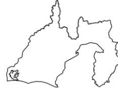
しずおかけん 静岡県