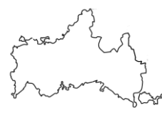
やまぐちけん 山口県