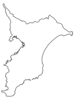
ち ば け ん 千葉県