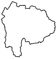
や ま な し け ん 山梨県