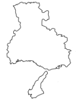
ひょうごけん 兵庫県