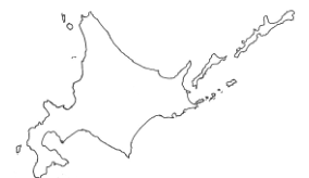
ほ っ か い どう 北海道