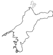
えひめけん 愛媛県