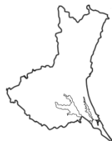
い ば ら き け ん 茨城県