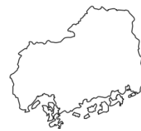
ひ ろ し ま け ん 広島県