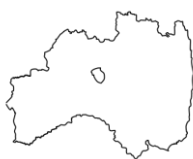
ふくしまけん 福島県