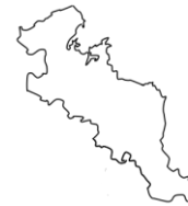
きょうとふ 京都府