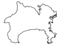
かながわけん 神奈川県