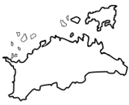
か が わ け ん 香川県