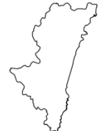
み や ざ き け ん 宮崎県