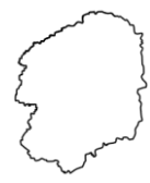
とちぎけん 栃木県