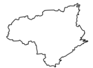
とくしまけん 徳島県