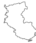
わ か や ま け ん 和歌山県