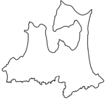
あ お り け ん 青森県