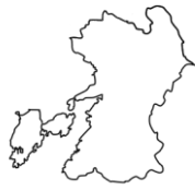
くまもとけん 熊本県