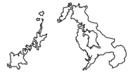
な が さ き け ん 長崎県