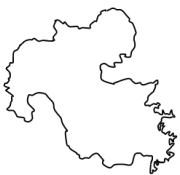
おいたけん 大分県