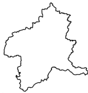
ぐ ん ま け ん 群馬県