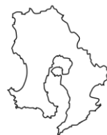
か ご し ま け ん 鹿児島県