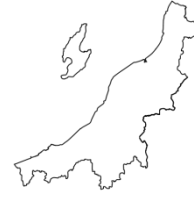
に い が た け ん 新潟県