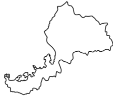
ふ く い け ん 福井県