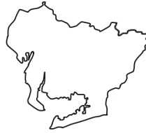
あ い ち け ん 愛知県